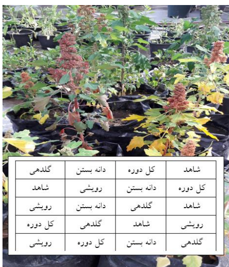
شکل ۱- جانمایی گلدانها و نمایی از گیاهان تیمار شده کینوا رقم NSRCQ در شرایط گلخانه‌ای

تفاوت معنی داری وجود ندارد. در صفات طول و عرض سنبله تنش در مراحل مختلف منجر به کاهش این صفات در مرحله رویشی (۲۰/۸ و ۲۲/۴ درصد)، تنش در مرحله گلدهی (۱۴/۳ و ۸/۹ درصد)، تنش در مرحله دانه بستن (۱۳/۳ و ۱۷/۹ درصد) و تنش در کل دوره رشد (۲۳/۳ و ۲۸/۴ درصد) شد و بیشترین میزان این صفات پس از تیمار شاهد به ترتیب در تیمار تنش در دوره دانه بستن (۱۱/۵۳ سانتی متر) و در دوره گلدهی (۶/۱ سانتی متر) مشاهده شد.