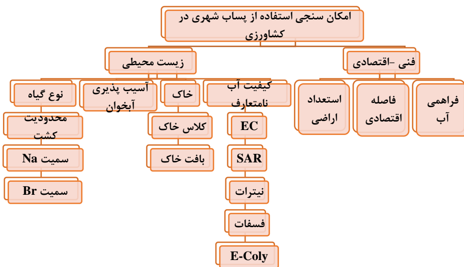
شکل ۲- ساختار تصمیم سلسله مراتبی

در این پژوهش برای تعیین ارزش هر معیار و زیر معیار از