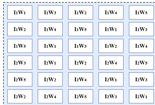
شکل ۲- جانمایی لایسیمترها به صورت شماتیک

برای خارج کردن آب اضافی از لایسیمترها، لوله‌هایی از جنس PVC به قطر ۵ سانتی‌متر و طول ۷۰ سانتی‌متر در نظر گرفته شد. روی لوله‌ها سوراخ‌هایی به قطر دو میلی‌متر و به فاصله ۲/۵ سانتی‌متر در ۴ ردیف در ۵۰ سانتی‌متر از طول لوله به عنوان زهکش در نظر گرفته شد. به منظور جلوگیری از ورود ذرات خاک به درون لوله‌های زهکش، از صافی ژئوتکستایل در اطراف لوله زهکش استفاده شد. این