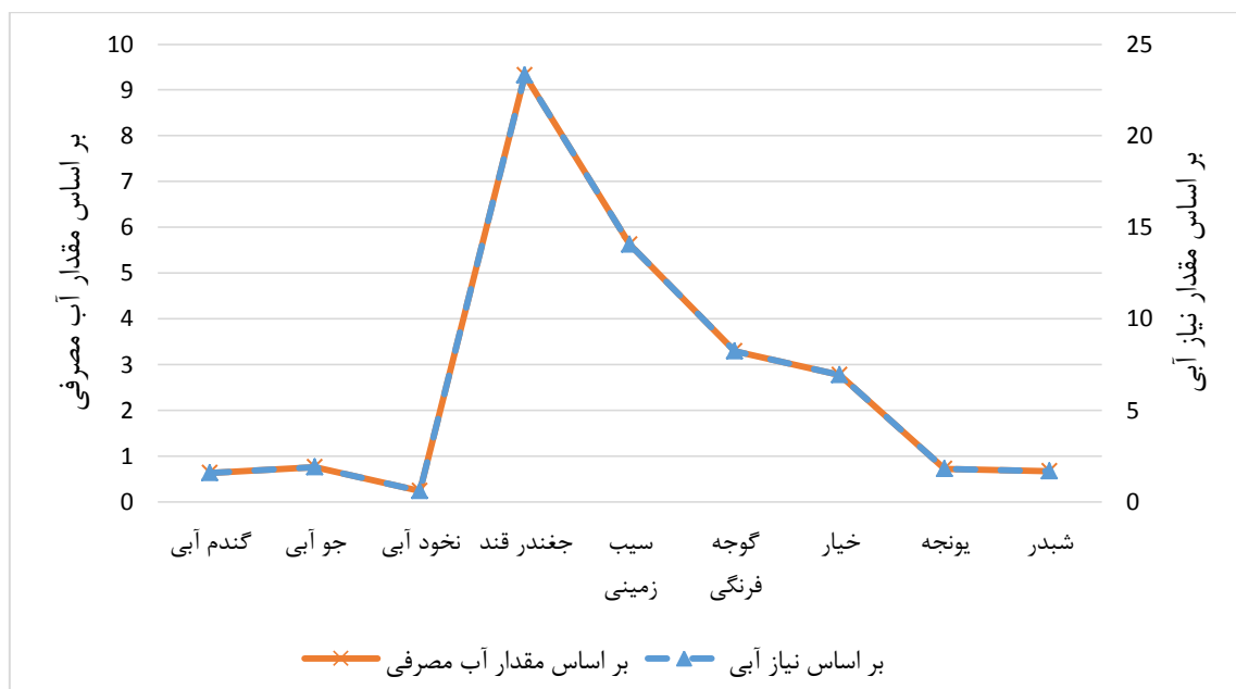
شکل ۱- مقدار بهره‌وری فیزیکی آب بر اساس مقدار آب مصرفی و نیاز آبی محصولات (واحد: کیلوگرم بر متر مکعب)

مأخذ: سازمان جهاد کشاورزی استان کردستان (۱۳۹۵)