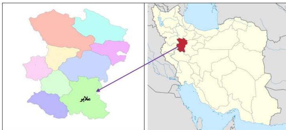
شکل ۱- موقعیت منطقه مورد مطالعه (شهرستان ملایر)

تبدیل شد. بارندگی مؤثر به روش SCS برآورد شد (SCS, 1972). مقادیر نیاز خالص آبیاری با مقادیر سند ملی آب برای مناطق مورد