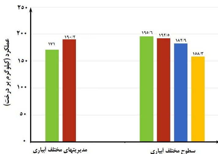
شکل ۲- میزان عملکرد درخت بر تقال در سطوح و مدیریت‌های مختلف آبیاری