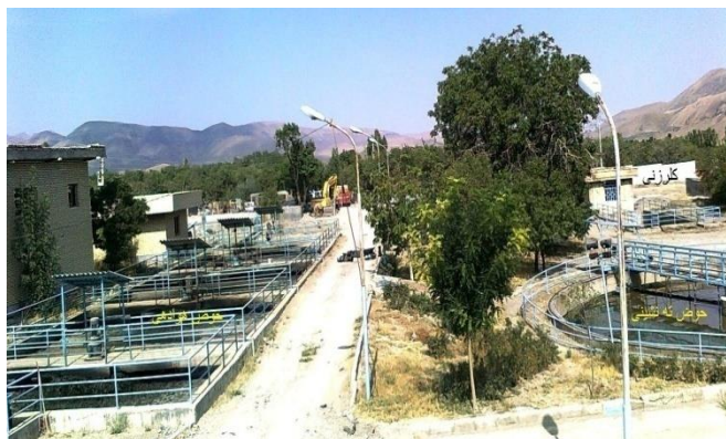
شکل ۱- تصفیه‌خانه فاضلاب تفرش، ایران

سایت تصفیه‌خانه شهر تفرش با ظرفیت ۴۲۰۵ مترمکعب در شبانه‌روز، جمعیتی معادل ۲۳۰۸۵ نفر را تحت پوشش خدمات دفع بهداشتی فاضلاب قرار می‌دهد. تصفیه‌خانه فاضلاب این شهر در سال ۱۳۷۷ با ظرفیت ۱۲۸۰۰ نفر با فرایند لجن فعال از نوع هوادهی گسترده ساخته شد که با توجه به افزایش جمعیت شهر، دیگر این تصفیه‌خانه جوابگو نبود و مسئولین را بر آن داشت که فاز دوم تصفیه‌خانه را راه‌اندازی کنند. فاز دوم با فرایند لجن فعال MLE همراه با ته‌نشینی اولیه در اسفند سال ۱۳۹۵ به بهره‌برداری رسید. واحدهای مختلف تصفیه‌خانه فاضلاب تفرش شامل تصفیه مقدماتی، اولیه و ثانویه و نهایتاً گندزدایی پساب است (شکل ۱).