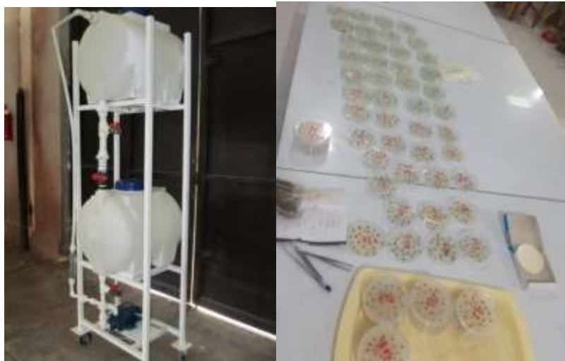
شکل ۱- الف) شمای دستگاه مغناطیسی کننده سیالات ب) پتری دیش های حاوی بذر برای تست جوانه زنی