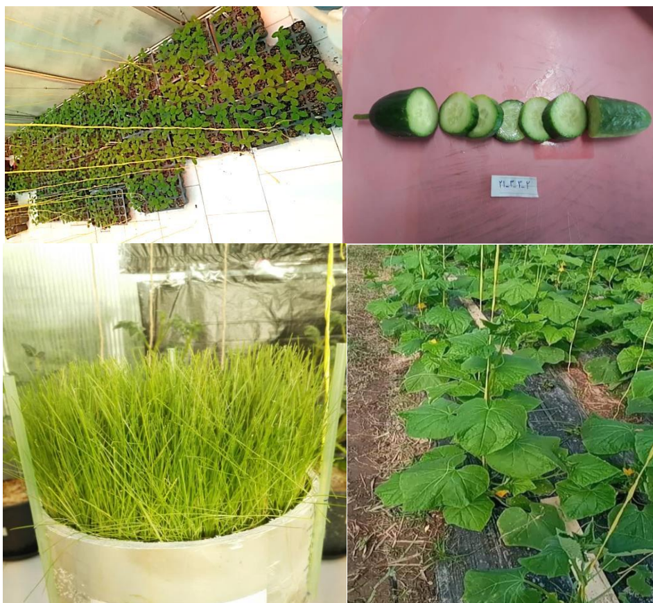
شکل ۱- تصاویری از مراحل کاشت، داشت و برداشت خیار به همراه میکرو لایسی متر حاوی چمن