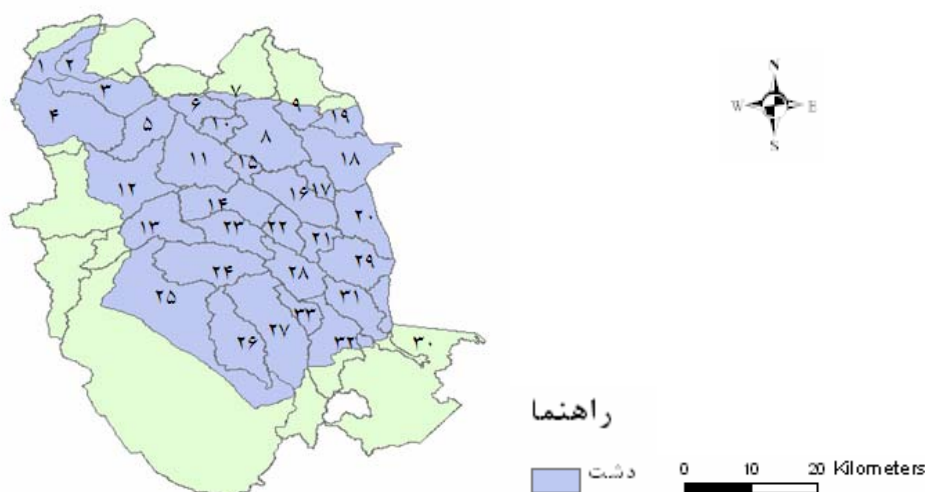
شکل ۱- نمایش موقعیت قرارگیری دشت‌های استان

شده از روش فرآیند تحلیل سلسله مراتبی ۴ (AHP) استفاده شد. در روش AHP اقدام به کلاس‌بندی نقشه‌ها گردید. برای کلاس‌بندی، تنها نقشه‌های پهنه‌بندی عوامل محدودیت‌زا برای اجرای آبیاری بارانی استفاده شد (اقلیم: دما، باد؛ کیفیت آب زیرزمینی: pH، SAR، سدیم، کلر و بی‌کربنات؛ سرعت نفوذ در خاک؛ توپوگرافی). به این صورت که دامنه مناسب هر پارامتر برای اجرای سیستم آبیاری بارانی مشخص گردیده و بر اساس تناسب اجرای این روش آبیاری، به ۹ کلاس طبقه‌بندی شدند. کلاس ۱: پارامتر با وضعیت خیلی خیلی بد، کلاس ۲: پارامتر با وضعیت خیلی بد، کلاس ۳: پارامتر با وضعیت بد، کلاس ۴: پارامتر با وضعیت نسبتاً بد، کلاس ۵: پارامتر با وضعیت متوسط، کلاس ۶: پارامتر با وضعیت نسبتاً خوب، کلاس ۷: پارامتر با وضعیت خوب، کلاس ۸: پارامتر با وضعیت خیلی خوب، کلاس ۹: پارامتر با وضعیت عالی.