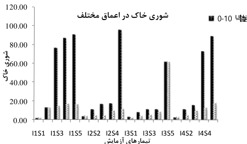
شکل ۳- پروفیل شوری خاک لایسیمترها تحت تنش‌های مختلف شوری آب دریای خزر و تنش آبی پس از اتمام آزمایش‌ها (EC۲ شوری عمق ۱۰-۰ و EC۱ شوری عمق ۳۰-۲۰ سانتی متری خاک)

در هر ردیف، میانگین‌های دارای حروف مشترک فاقد اختلاف معنی‌دار در سطح پنج درصد هستند (حروف خارج پرانتز).