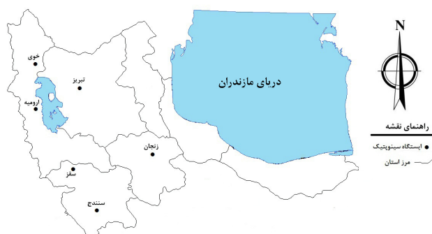
شکل ۱- موقعیت مکانی ایستگاه‌های منتخب در شمال غرب ایران