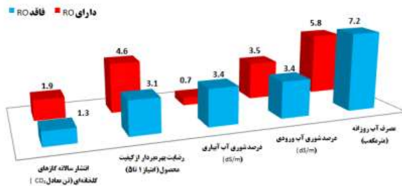
شکل ۲- مقایسه شاخص‌های کلیدی گلخانه‌های فاقد و دارای سامانه اسمز معکوس (RO)